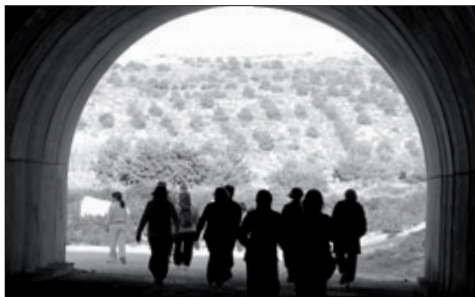
Tunel de la circumval·lació direcció a les Puntetes de Gosàlvez

Per això, el mes de novembre passat, el BLOC de l'Alacantí va atorgar a la Colla Muntanyenca el Premi Compromís pel Medi Ambient. Se l'han guanyat per defensar la nostra riquesa natural tots els dies i des de fa molts anys. Voleu una prova d'això? El passat diumenge 10 de febrer van plantar 100 arbres més a les Puntetes de Gosàlvez.