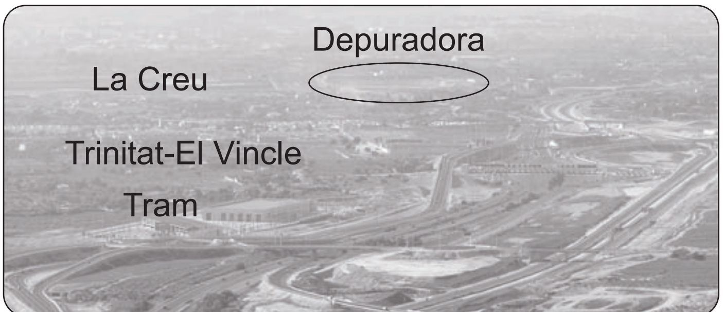
La circumval·lació des de Xixí, amb la depuradora al fons.

NO A LA DEPURADORA PER MOLESTA I PER IL·LEGAL!