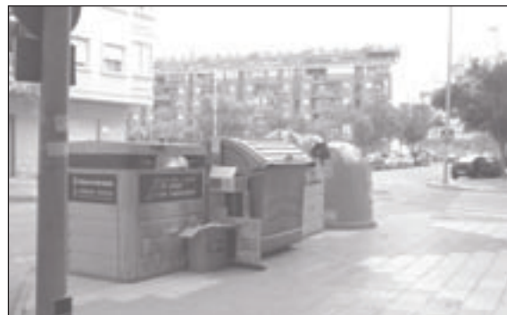
Imatge dels contenidors situats en l'avinguda Germanies a les 11:30 h. JA ESTAVEN PLENS

VOLEM UN POBLE NET I FACILITATS PER A RECLICAR!