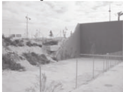
El frontó del Campello, imatge d'un poble turístic

que sí, que ja està, que ve. Potser ja funciona, però és un secret. No sé, no sé... No és per a riure, la realitat és que ja fa uns quants anys que estem en la misèria que il·lustren estes imatges.